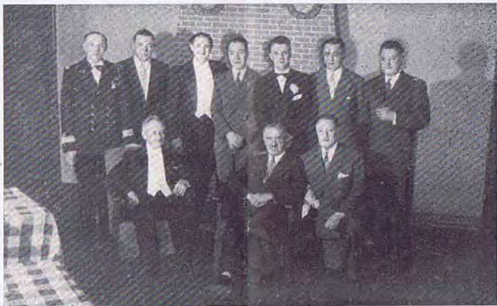
Le Comité du Brabant.