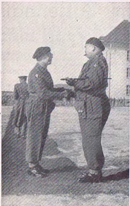
« L'Àu Revoir » des deux Chefs de Corps.