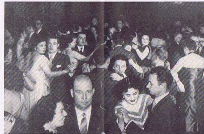
Un aperçu de la foule des danseurs.

Notre foire aux échantillons a connu un succès sans pré-