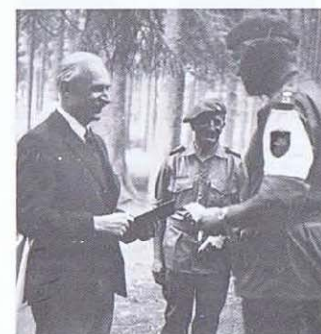
Bois-St-Jean: le comte Ch. de Limburg-Stirum