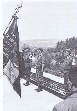
Martelange: les Chefs de Corps des 1 et 3 ChA.

Après avoir rendu un hommage solennel au monument national à Martelange, les marcheurs se sont souvenus des maquisards du Bois-St-Jean, du sacrifice de nos alliés américains, britanniques et français.