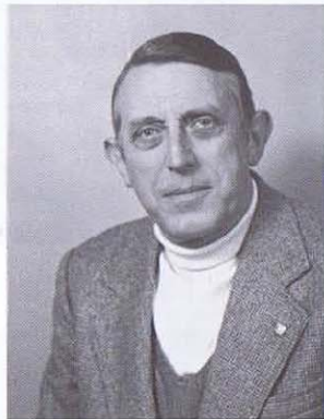
Le Chasseur Ardennais Lheureux