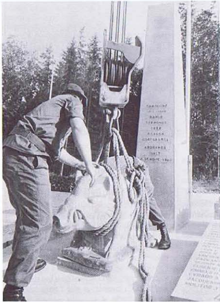
LE MONUMENT DES 1 ET 4 Ch.A. A MARCHÉ-EN-FAMENNE