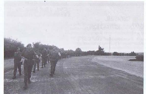
Le 1 Ch.A. au Mardasson à Bastogne