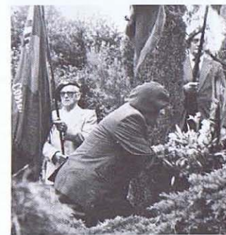
Rochelival: le Commandant Liégeois