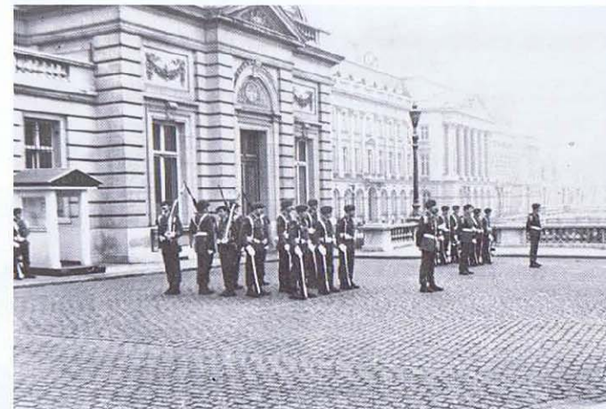
Le 1ChA assure la relève du 3 ChA au Palais de Bruxelles.