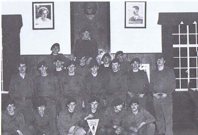
Le Peloton vainqueur du Challenge Fusilier d'Assaut