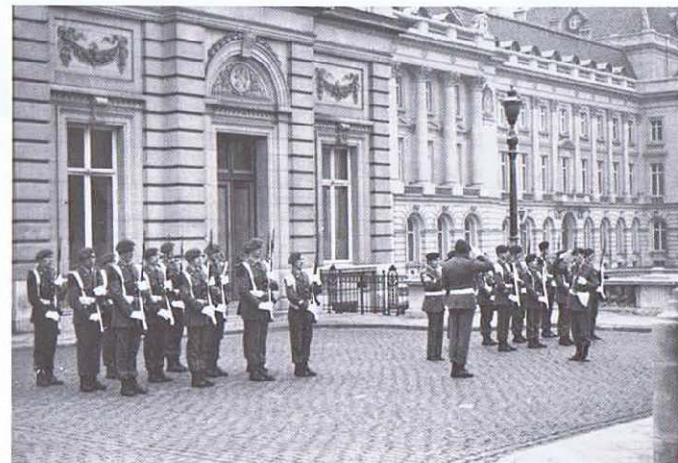
Le 3 Chasseurs Ardennais reprend la garde au Palais de Bruxelles