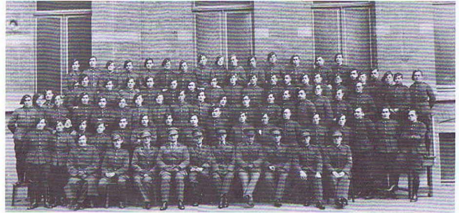
Photo prise à la fin de la session de Candidats Sergents à la Compagnie Ecole de la Division de Chasseurs Ardennais, rue de Fer à Namur

Session de mars 1938 à mars 1939 (de bas en haut et de gauche à droite):