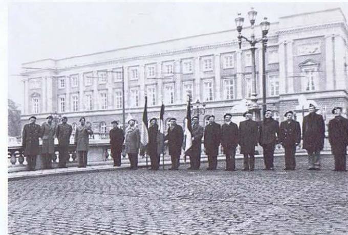
La délégation des Anciens et l'ancien et le nouveau Chef de Corps.