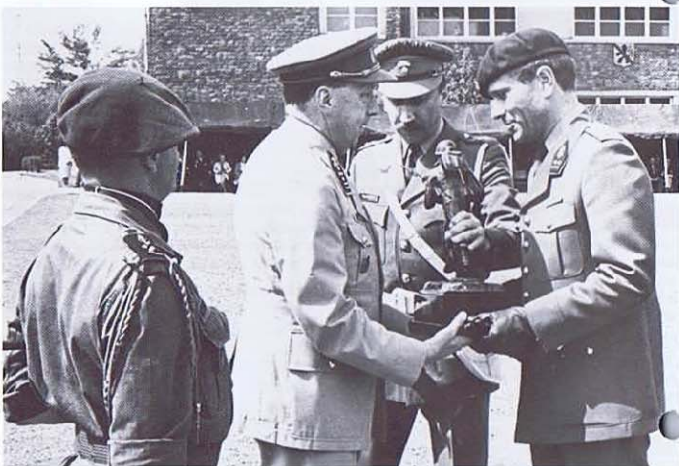
4. Le peloton du 3 e Chasseurs Ardennais et ses trophées.