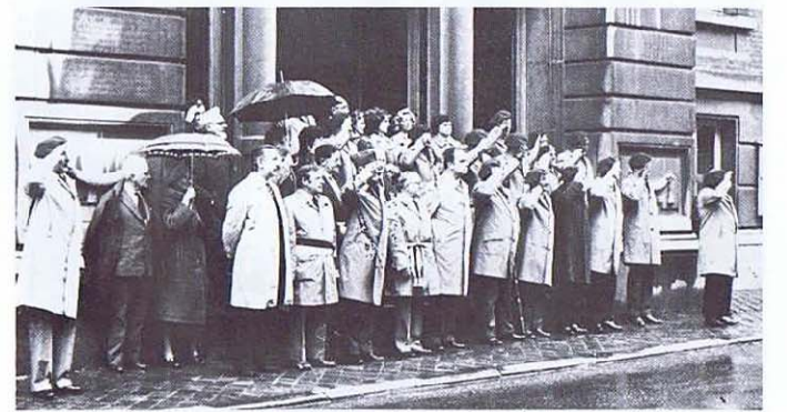
La plaquette d'honneur de la Fraternelle au Sénateur-Bourgmestre de Rochefort.