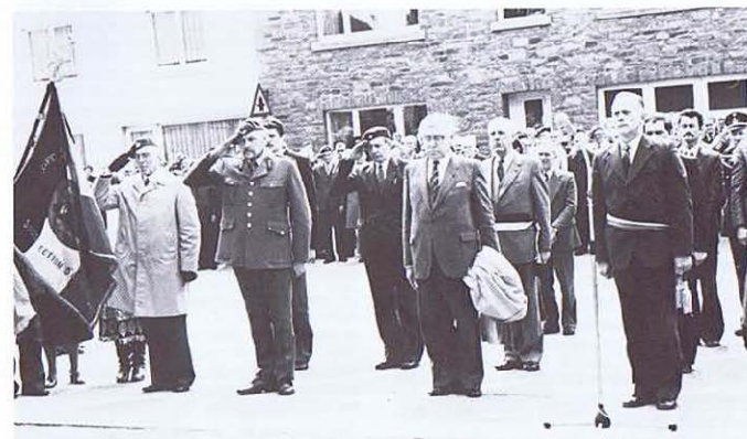
L'hommage au monument aux morts.