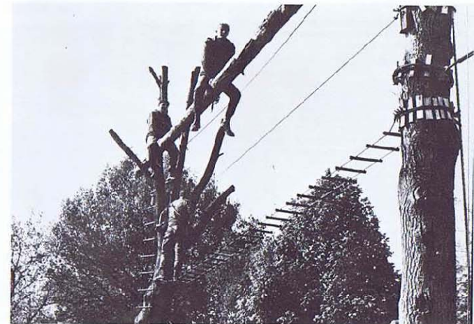
Journée «Portes ouvertes» démonstration de pisto de cordes.

Ultime rappel pour payer la cotisation 1981