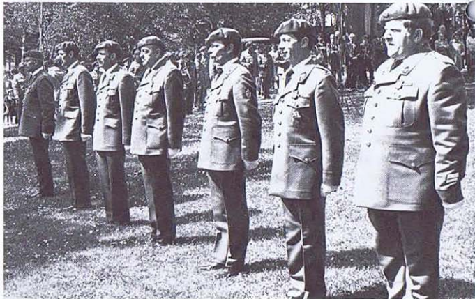
Le groupe des décorés.

Ziel so schnell und so gut wie möglich für alle Fälle bereit zu sein. Jeder weiss, was es dem Infanteristen an Kraft kostet um durchzuhalten, um sich selbst zu meistern, und um an sein Ziel zu kommen. Aber welche Genugtuung, wenn wir nach und nach zu einem richtigen Ardennejäger heranreifen, fähig zu kämpfen und zu siegen.