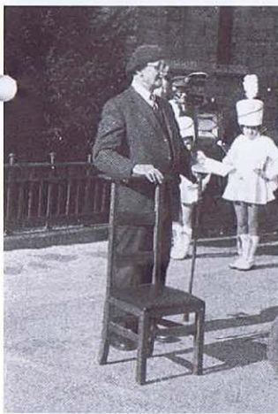
Le président Eppe prononçant un de ses derniers discours.

Il s'est éteint la veille de l'Ascension, terminant à peine son ultime discours ; il venait de saluer, avec tout son grand cœur, tout son bel esprit, un ancien déporté de Vance. C'est devant la stèle élevée en souvenir des victimes des deux guerres, que notre président s'effondra... Jusqu'à la dernière seconde de sa vie, il aura donné le meilleur de lui-même à tous ceux qui payèrent un large tribut à la cause de la Patrie.