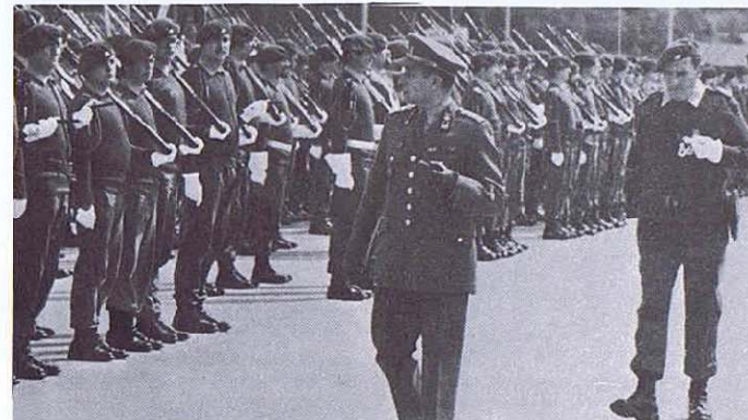
Le général-major Liebens, Comd 1 Div., passe le 1 ChA en revue.

La prise d'armes se clôtura par un défilé à pied précédé par un concert donné par la Musique des Forces de l'Intérieur.