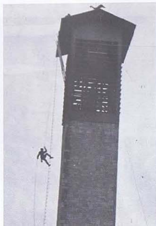
Descente du clocher de Marloie.