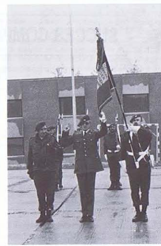
Prestation de serment.

Participaient à la compétition: 1 C, 1 Gr, 5 Li, 6 Li, 12 Li, 2 Cy, 3 ChA.