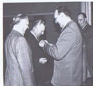
Les décorés entourant le président national.