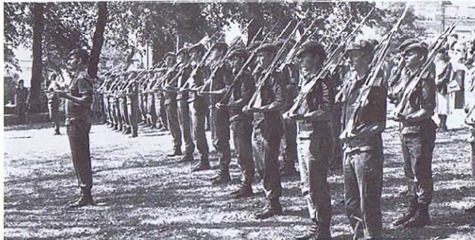
Un aperçu des dispositions des troupes de la 3 e Ci.

Was wir noch laten war natürlich unser Training im Quartier, auf dem Feld, im Lager, mit dem