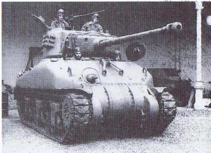
Le Tank Museum, asbl présidée par le lieutenant général e.r. F. Dewandre, a rouvert, depuis le 26 mars, son exposition de véhicules blindés militaires, datant de la seconde guerre mondiale.

Il est accessible au public tous les jours, sauf le lundi, de 9 h à 11 h 30 et de 13 h à 16 h 30. Entrée gratuite.