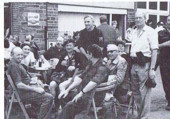
4 e étape à GRAND-HALLEUX - Au ravitaillement, dans l'attente du dernier effort à fournir.