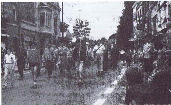
Défilé triomphant à Vielsalm.