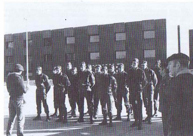
Semaine du soldat - Visite du CE PARA au 1 ChA