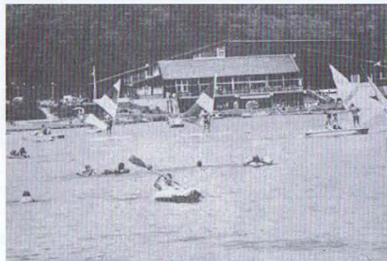
Virton - Centre touristique