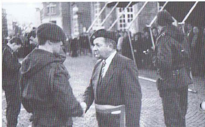
St Hubert - Ami reconnu avec certitude.

Le public s'attardait quelque peu près des AIFV baptisés chacun du nom d'une des localités de l'entité. En la salle communale, il y eut ensuite le drink de circonstance pour tous. Des «chonnailles» offertes par la ville accompagnaient les sandwichs et boissons amenées par la caserne.