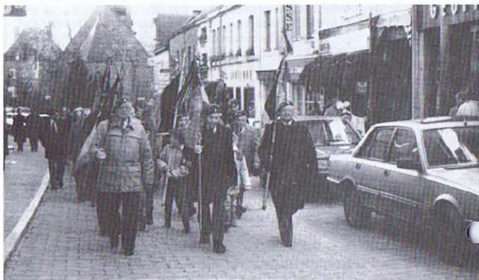
St Hubert - La jeune garde était là ....