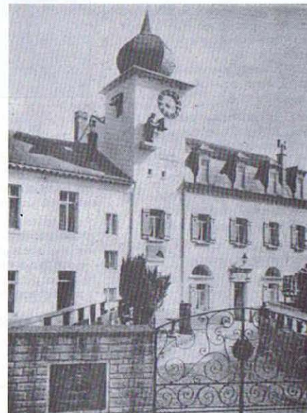
Virton - Vie culturelle