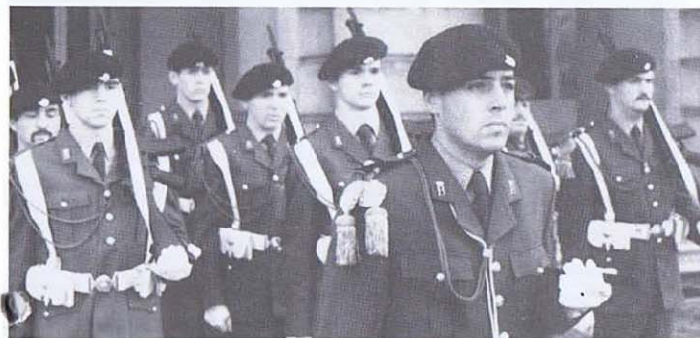
La garde aux Palais Royaux