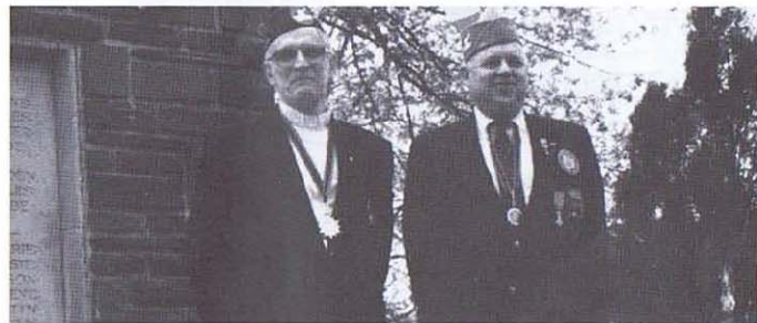
Le 9 mai nous recevions à Dochamp la visite d'Anciens Combattants de la 84 e division d'infanterie U.S. ayant combattu en décembre 1944 et janvier 1945 dans notre région.

Aux familles de camarades disparus nous réitérons nos plus sincères condoléances.