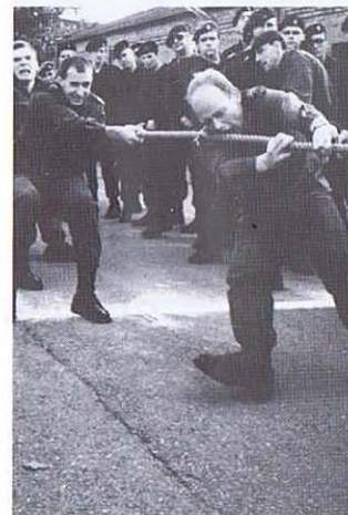
Résiste et mordis

Dès 14 heures, la compétition reprenait ses droits, d'une part avec une séance de tir (Fal, Vig, GP) et d'autre part, un tournoi de Hand Ball entre les Cie. Ces deux épreuves furent remportées par la Cie EMS.