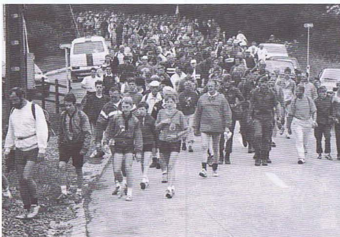
Le flot des marcheurs au départ de Bodange