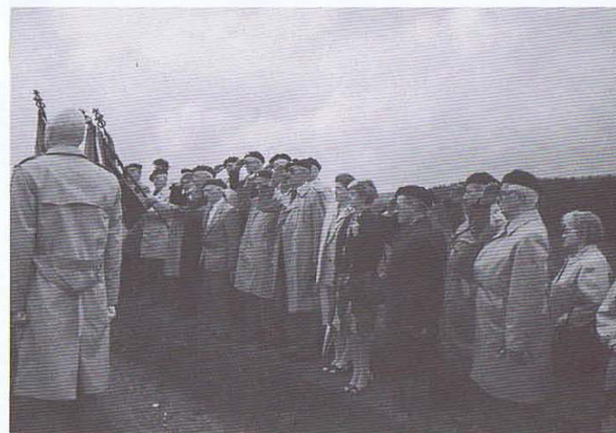
Recueillement devant la Croix au Commandant Bricart