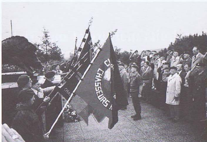
Le drapeau de notre Club au Monument National