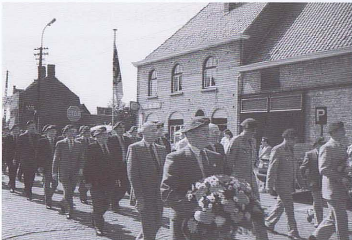
Vue d'une partie du défilé