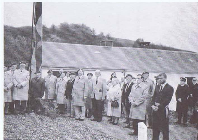
Devant le Monument aux Chasseurs Ardennais — Route de Fauvillers