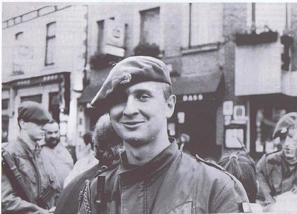
Fier de l'être