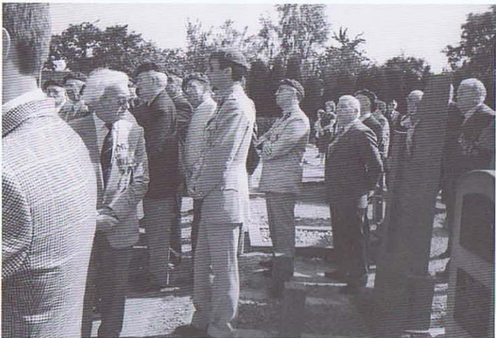
Devant la Monument des Victimes Civiles