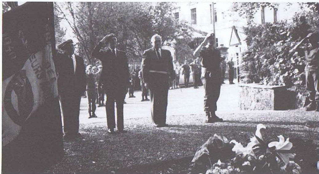
Le drapeau de notre Club au monument National