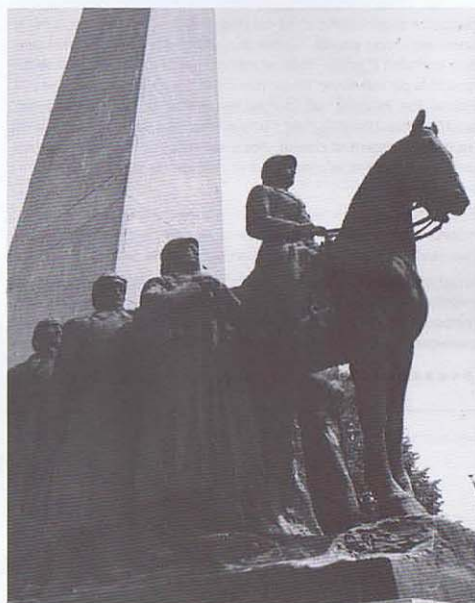
Le Monument National de la Lys vu de droite et de gauche: Le Chasseur Ardennais est bien là, sur le côté droit et avec son béret.