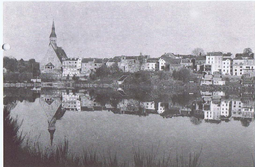
L'église de Vielsalm vue du lac