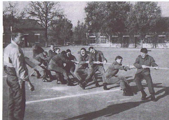
La 3 Fu en action