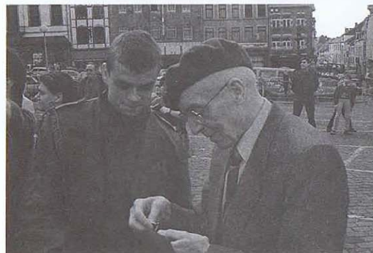
Remise des Hures à Saint-Hubert (2 e Cie)