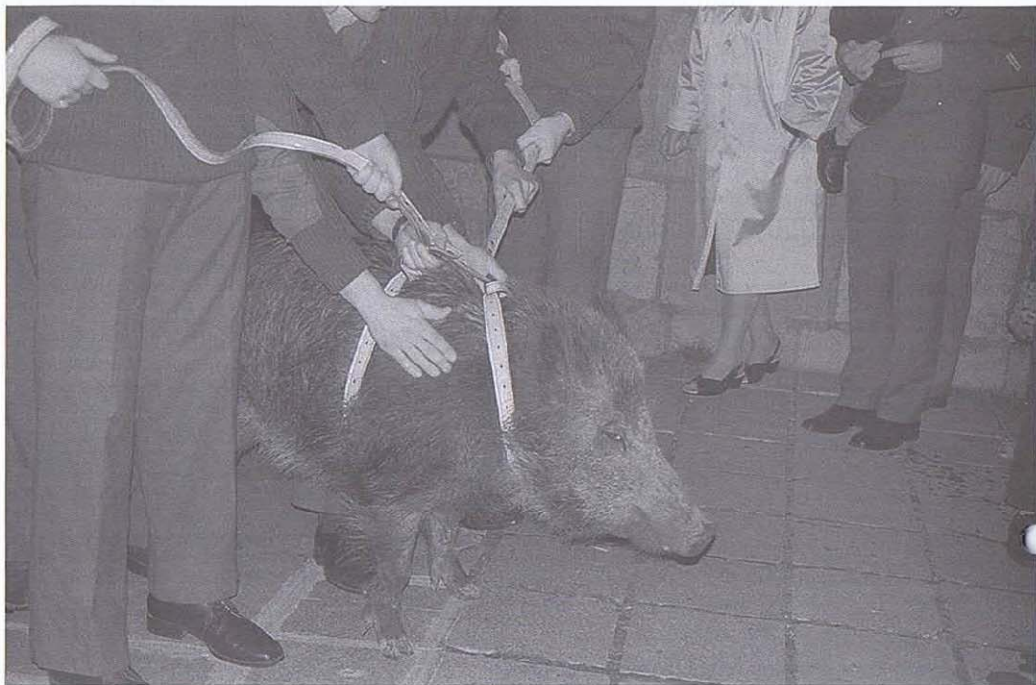
HERA notre nouvelle mascotte