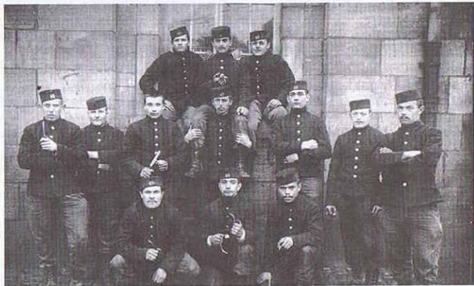
Un dernier peloton "convée patates" avant le départ d'ARLON à MARCHOVELLETTE en juillet 1914. - 10 ème de Ligné d'ARLON