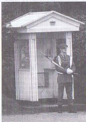
Sentinelle de faction au Palais de LAEKEN Schildwache in LAEKEN