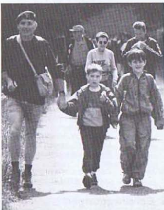
De tous âges et de bonne humeur; ne sont-ils pas sympathiques, nos marcheurs?