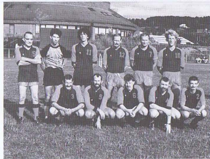
Le Club Sportif Ardennais.