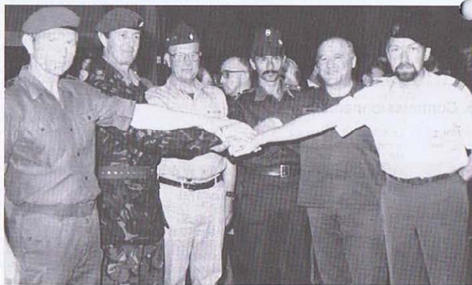
Un geste fraternel de la part de nos chefs. Vive l'Amitié Internationale.

Von allen Altern und mit rosiger Stimmung; sehen sie nicht sympathisch aus unseren Marschierern?