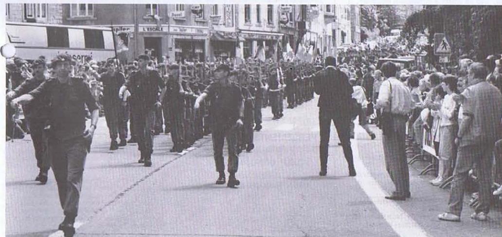
1ChA Chef de Corps en lête