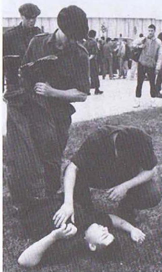
Omnisports: après le dur effort des 15 Kms. Photo 1 ChA