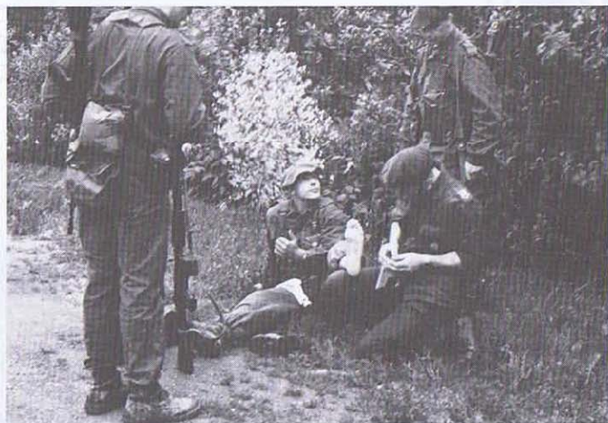
MSA 91: un petit "bobo" et on repart