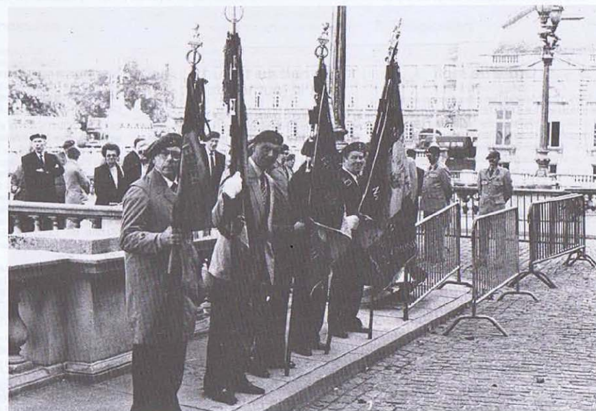
Nos porte-drapeau toujours fidèles