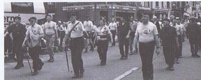
An der Spitze des Marschklubs der Ardennenjäger, die vier "ältere" Marschierer.