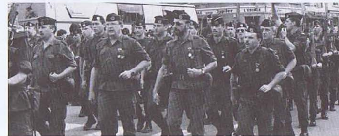
Der 1 ESO, die beste belgische Abteilung