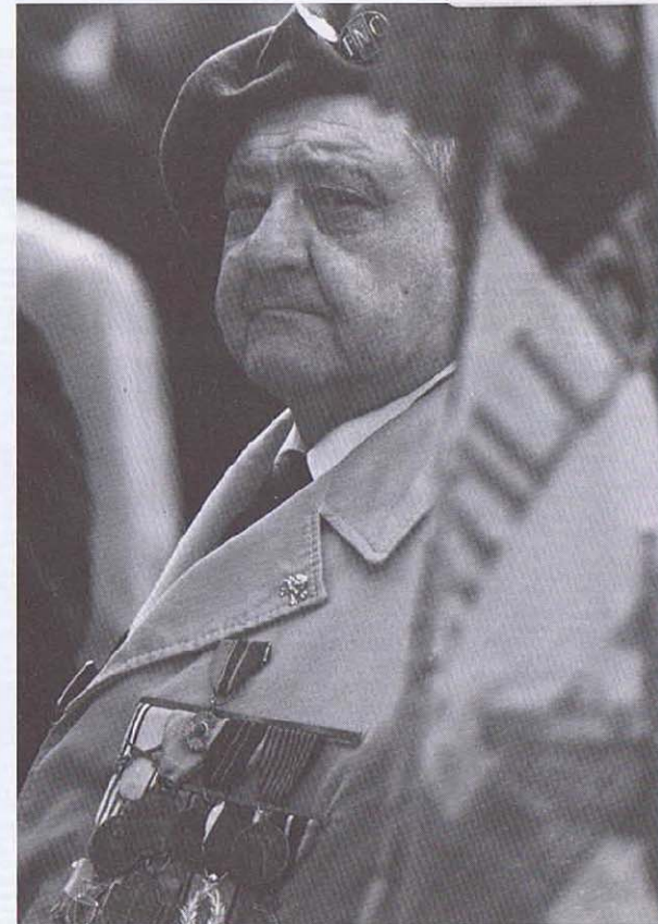
Un Chasseur Ardenais au Heysel, le 29 mai 1991