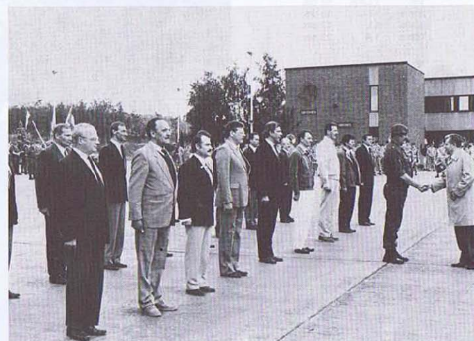
Les gens du "LECLERC 71" ... 20 ans après.