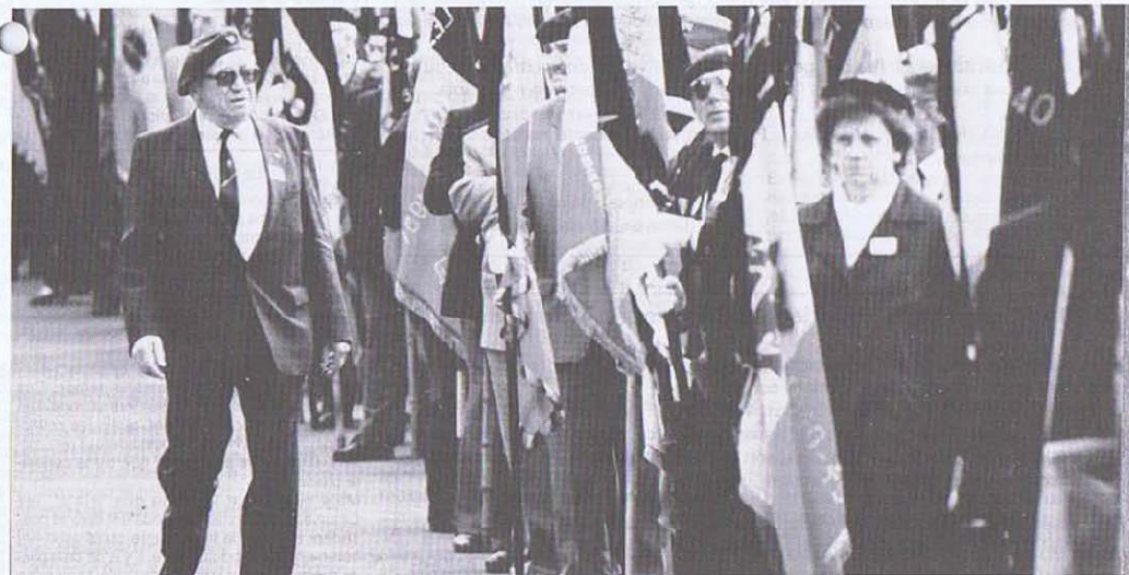
Qui est ce porte-drapeau et quel est sa section et son drapeau?

Comment retrouver son drapeau dans une telle mer?