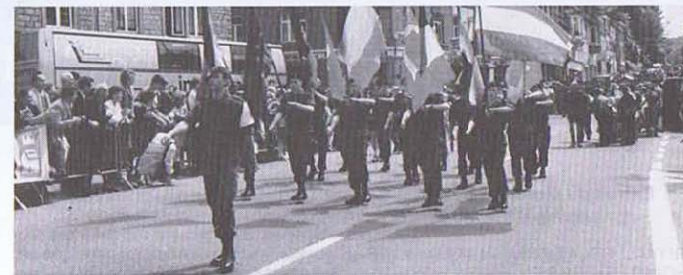
Fahnengruppe aller Nationen die während des Marsches vertreten waren.