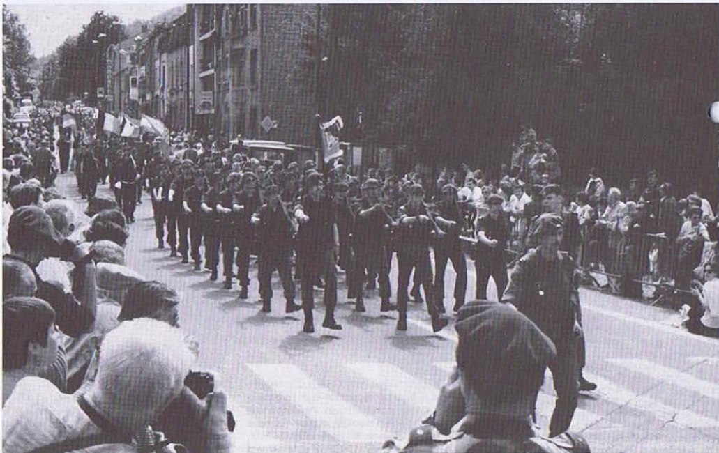
Vielsalm - Les Chasseurs Ardennais