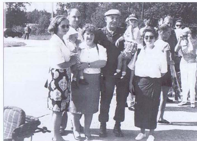
Retrê de Belbat VI Côté Brunin

Barbecue du 2 juillet pour les familles des membres de la section en mission en ex-Yougoslavie