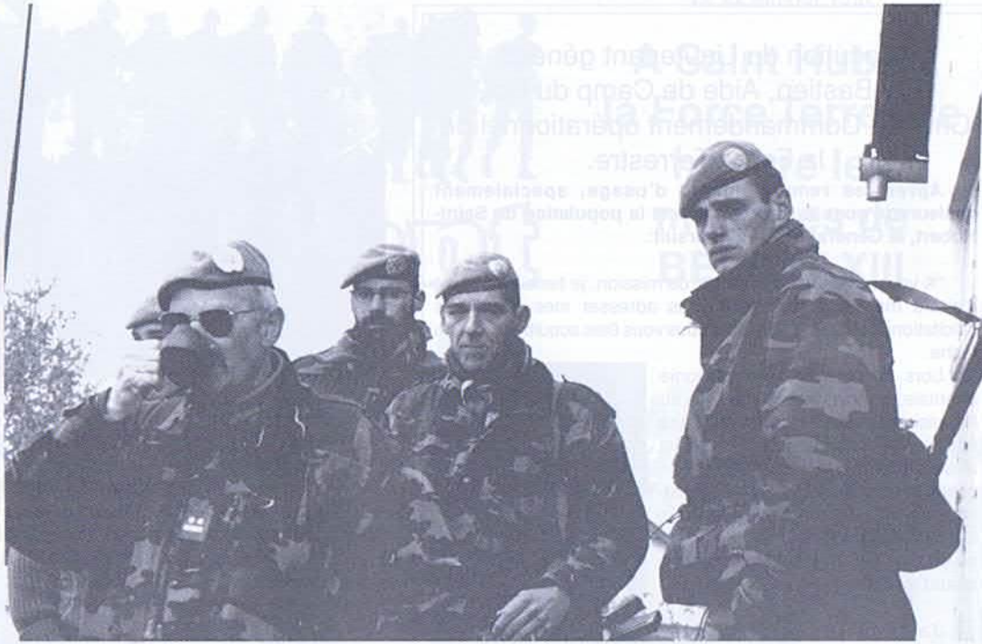
Matinée froide quelque part en Slavonie orientale. "Un petit café, mon Colonel"

Les anciens peuvent être fiers de leurs jeunes successeurs. Cadre et hommes ont été brillants.