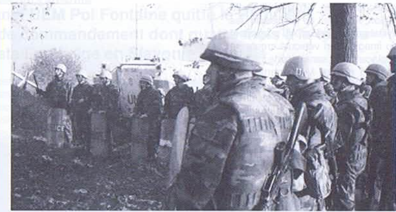
BelBat XIII, un bilan