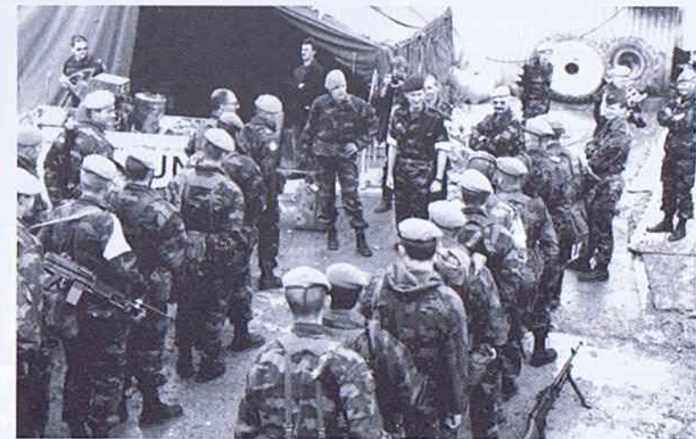
La même fierté devant SAR le Prince Philippe sur les lieux de la mission (ci-dessus) et lors du défilé de Saint Hubert (ci-dessous)