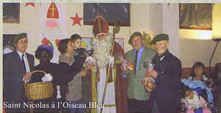
Saint Nicolas à l'Oiseau Bleu

Le 14 février, les membres du comité ont invité leur épouse ou compagne pour fêter la saint Valentin.