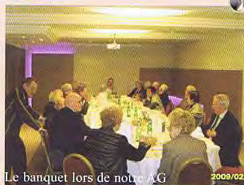
Le banquet lors de notre AG 2009/02 Plus d'informations et photos dans notre bulletin régional.

Le Président et l'assemblée ont chaleureusement remercié toutes celles et ceux qui ont contribué à l'organisation de cette belle journée.