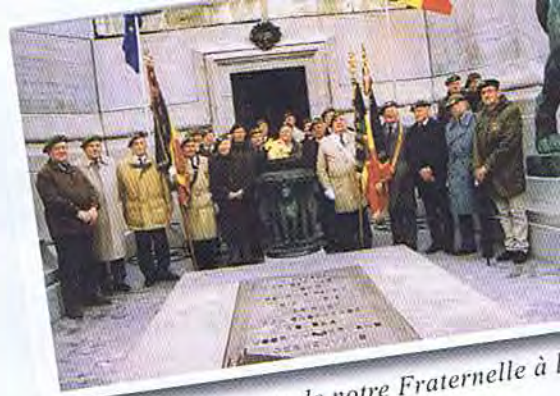
Les participants de notre Fraternelle à la cérémonie

Voici encore 2 photos prises par notre ami Emmanuel HYDE