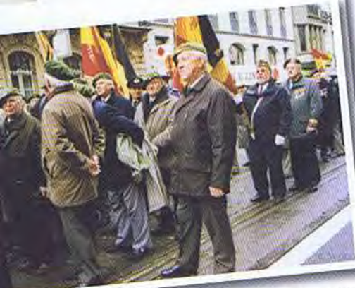
aperçu de chasseurs lors du rassemblement