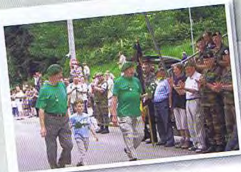
Le plus jeune et les plus anciens

tre Président National ont pris la parole.