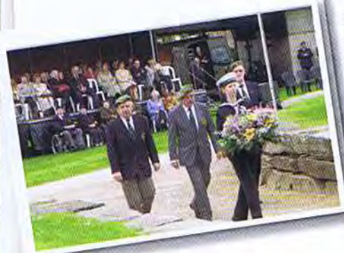
Le dépôt de fleurs

Les Chasseurs Ardennais, dont de nombreux porte-drapeau, venus des quatre coins du pays se sont retrouvés avant 10 heures à Courtrai au Diksmuidekaai devant le collège Saint Amand au bord de la Lys. Ils ont assisté au salut à l'étendard avant de gagner, en tête du cortège, le monument où se tenait la cérémonie.