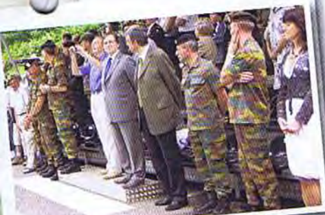
Les autorités lors du défilé