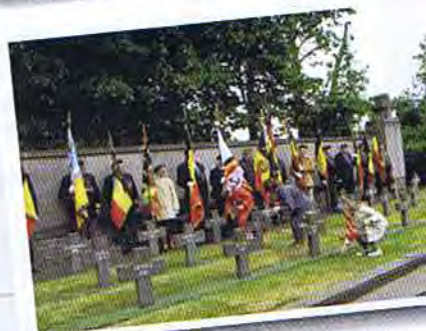
Dépôt de fleurs par les enfants