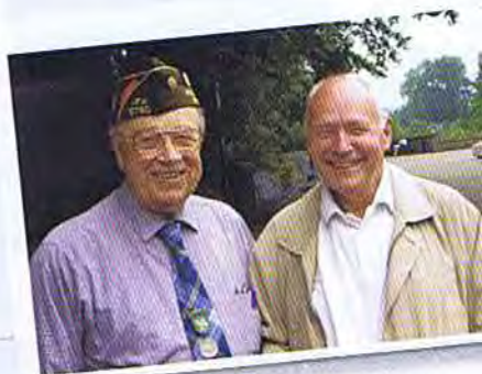
Portteus et Kelecom