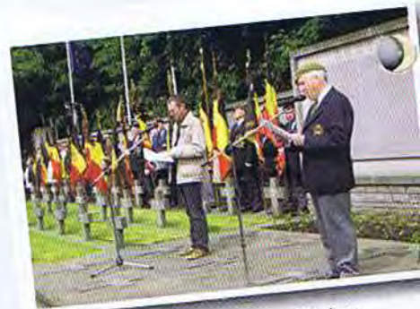
Appel aux victimes militaires

Les Chasseurs Ardennais se sont ensuite rendu au Monument des Chasseurs Ardennais où une couronne a été déposée avant la traditionnelle photo de famille. La journée s'est terminée par une réception offerte par la commune.