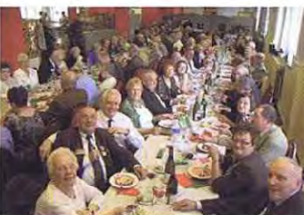
Quelques participants à Courtrai

Mercredi 8 septembre 2010 - 6h30 - Il fait noir, il pleut à verse ... un temps à ne pas mettre un chien dehors et cependant, nous sommes une douzaine, chasseurs ardennais ou sympathisants, à monter dans le car qui nous emmènera à Courtrai, but de notre excursion annuelle.