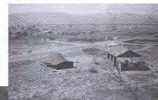
Bugarama - Vue du bivouac