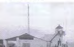
Aérodrome de Kamembe - Tour contrôle Cantonement 2Cie (-)