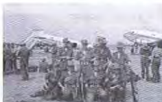
17 juillet Départ pour Opération Goma.