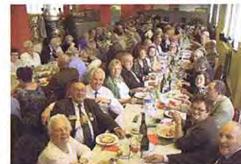
Une vue du banquet

C'est dans une somptueuse salle de la caserne Dufour de Rocourt que se sont retrouvés les Anciens Chasseurs Ardennais et leur famille ou amis.