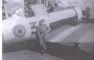
Aérodrome Kamembe - « Taxi de l'Aumôner Bou- quelle »... Sdt Dessouroux