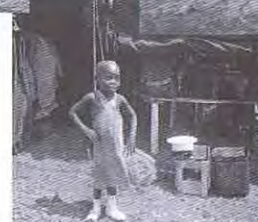
Bugarama (Ruanda) - Bivouac : « Le pro- tégé du 3 pl - 2 Sec »