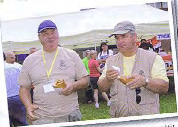
L'ancien directeur de la MESA a bon appétit