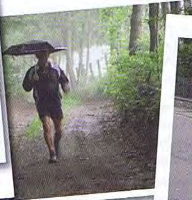
Il pleut, il pleut bergère...