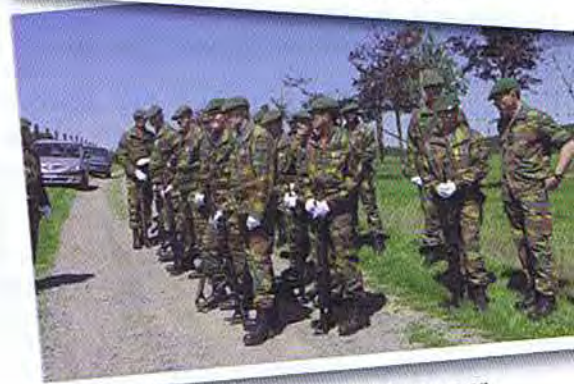
Le détachement d'honneur