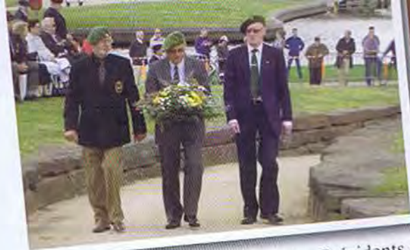
« Le Président National et les Vice-Présidents »

Notre Fraternelle a défilé en tête des associations patriotiques