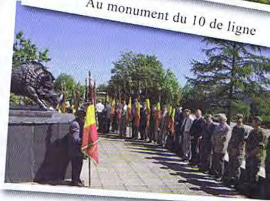
Au monument national