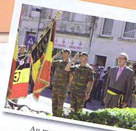
Au monument du 10 de ligne

Comme souvent, Vielsalm était la ville d'arrivée de la dernière étape de la MESA. La 45 e marche du souvenir se clôtura par le défilé final et une réception.