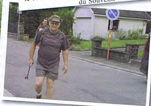
Un marcheur de notre Fraternelle