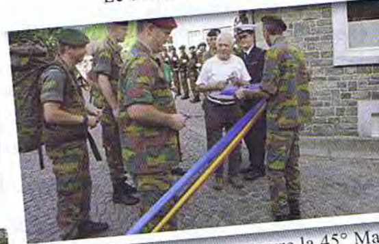
le commandant de brigade ouvre la 45 e Marche du Souvenir