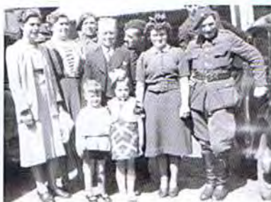
Photo prise à Antheit en famille le 21 avril 1940.