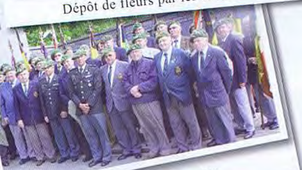
Les Chasseurs présents