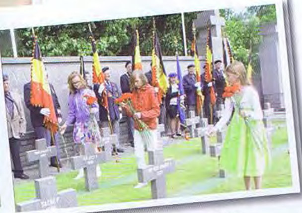
Dépôt de fleurs par les enfants