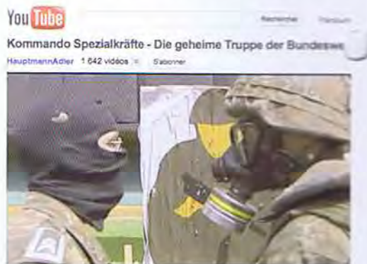
Le Kommando Spezialkräfte (Unité des forces spéciales KSK) fait partie des forces spéciales de la Bundeswehr.