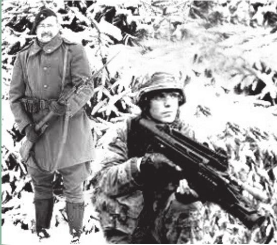
LES CHASSEURS ARDENNAIS APRÈS LA GUERRE