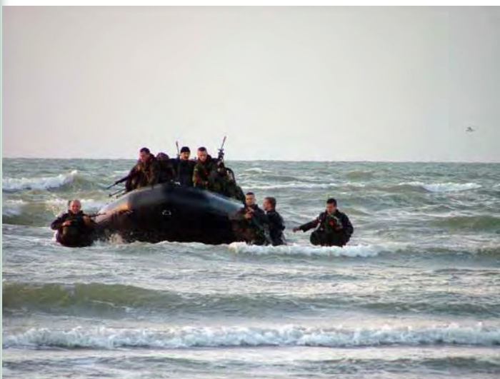
Le Zodiac n'arrive pas jusqu'à la plage. C'est à pied et dans l'eau que se termine le débarquement.