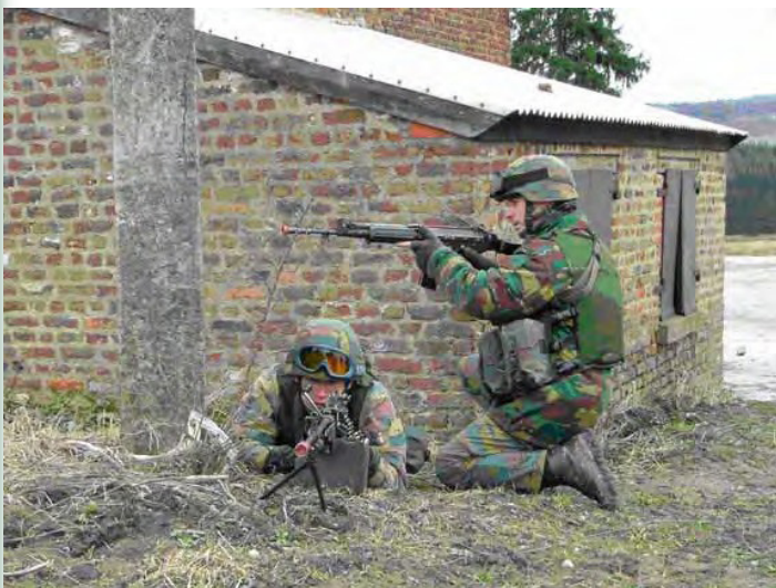
Une équipe protège les abords du village de Focagne pour permettre au reste du peloton d'investir les maisons.