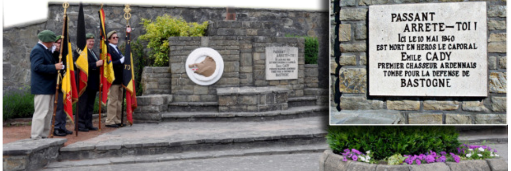
Monument en hommage au Caporal Emile Cady du 2 ChA

En 1940, le 10 mai, la Belgique est envahie par l'Allemagne. A la fin de la journée, les Allemands occupent Bastogne en dépit de l'héroïque résistance des Chasseurs Ardennais qui ont perdu un des leurs, le caporal Emile Cady du 2e Régiment de Chasseurs Ardennais/2e Bataillon/5e Compagnie.