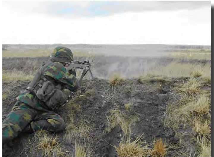
Tir MINIMI dans la plaine de Bourg-Léopold.