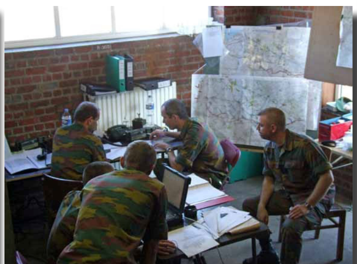
Le PC du Régiment s'est installé pour quelques heures dans les locaux de la salle des fêtes de Wingene, en Flandre occidentale.