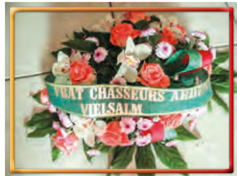
Wereth - Die Ardennenjäger aus Vielsalm