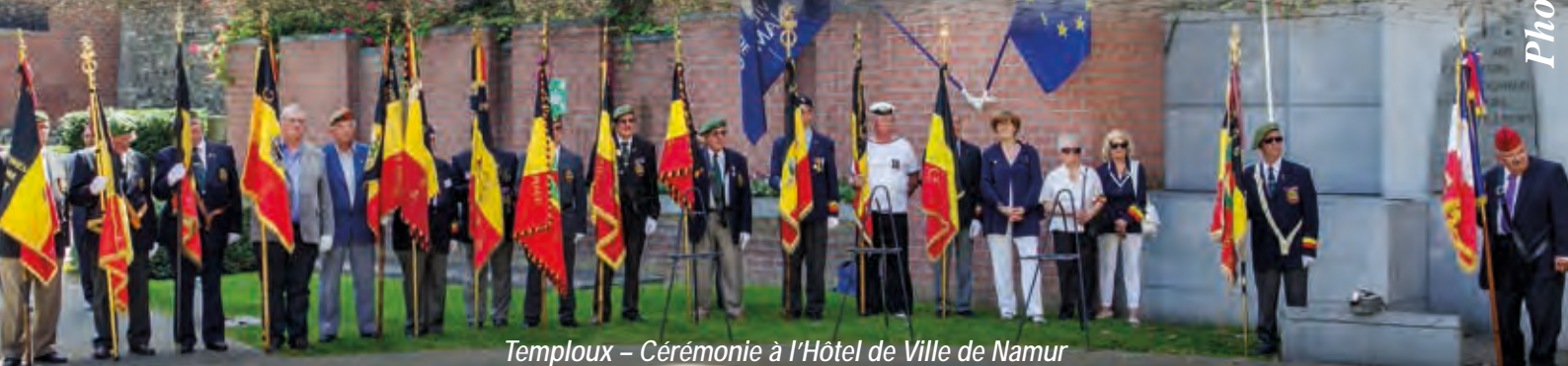
Temploux - Cérémonie à l'Hôtel de Ville de Namur