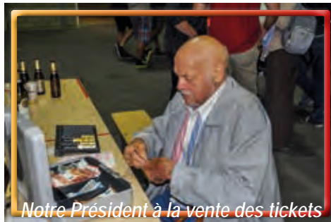
Notre Président à la vente des tickets

Il s'agissait d'une après-midi détente avec quelques activités sportives plus ou moins intenses, suivant les goûts et les possibilités de chacun, allant de la marche gourmande à la randonnée vélo et divers jeux pour les enfants. Certains d'entre nous ont donné un coup de main à l'organisation tandis que d'autres ont simplement profité de l'occasion pour vivre un bon moment au cœur de nos Bérêts Verts d'aujourd'hui.