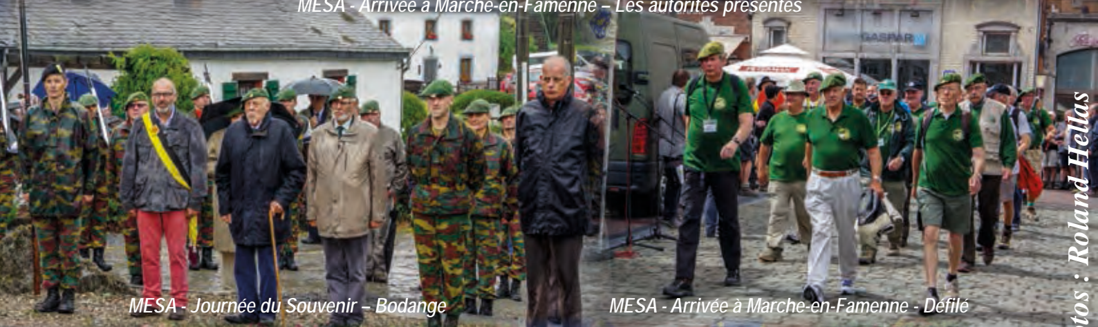
MESA - Journée du Souvenir - Bodange