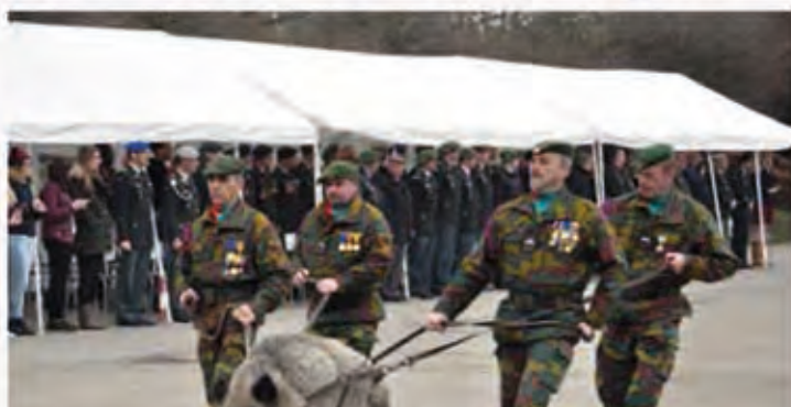
Diane défilait régulièrement lors des parades.

Triste nouvelle pour les Chasseurs Ardennais installés au camp Roi Albert de Marche. Ce mardi 13 juin, ils ont perdu leur mascotte, une laie appelée Diane. Celle-ci est décédée suite à un problème cardiaque. Diane était née le 5 décembre 2007. Actuellement, elle pesait 130 kilos. Cette mascotte était régulièrement de sortie. Elle prenait notamment régulièrement part aux parades et autres défilés militaires. Il était d'ailleurs prévu qu'elle défile le 30 juin lors du défilé de clôture de la MESA (Marche Européenne du Souvenir et de l'Amitié) à Marche.