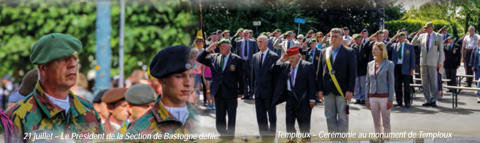
21 juillet - Le Président de la Section de Bastogne défile