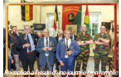
Réception à l'issue d'une journée bien remplie

8779 marcheurs différents pour un total de 15861 marcheurs cumulés sur les quatre jours. 18 nationalités différentes, dont 1 Népalais, 1 chinois, 1 russe, 1 marocain, 1 australien, 20 américains ; pour le reste, il s'agit d'Européens. Le plus jeune : 3 ans, le plus vieux 87 ans. ¼ des marcheurs sont des femmes.