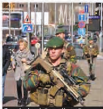
En mission à Bruxelles. ©

de tous les terrains. Depuis quinze jours, ils participent à nouveau à une mission de sécurisation dans les rues de Bruxelles. ●