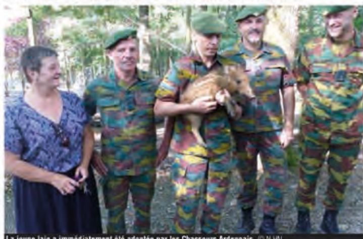
La jeune laie a immédiatement été adoptée par les Chasseurs Ardennais.

Hubert est donc accueilli avec joie. « D'autant plus qu'une si jeune petite laie vivra bientôt rejoindre la première ». En attendant, le petit animal offert ce vendredi par la commune de Saint-Hubert