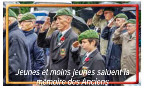
Jeunes et moins jeunes saluent la mémoire des Anciens

8779 marcheurs différents pour un total de 15861 marcheurs cumulés sur les quatre jours. 18 nationalités différentes, dont 1 Népalais, 1 chinois, 1 russe, 1 marocain, 1 australien, 20 américains ; pour le reste, il s'agit d'Européens. Le plus jeune : 3 ans, le plus vieux 87 ans. ¼ des marcheurs sont des femmes.