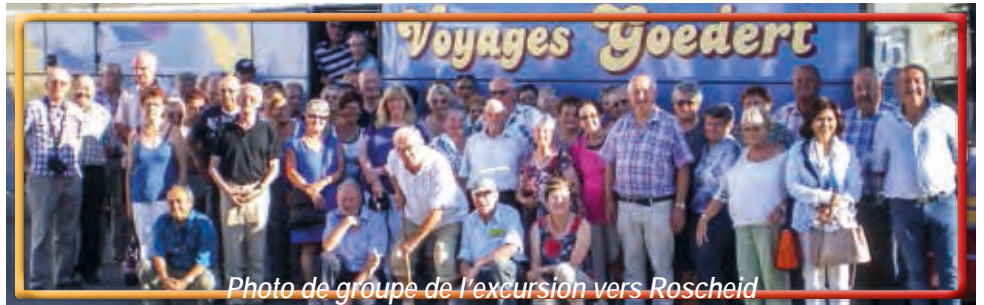
Photo de groupe de l'excursion vers Roscheid

Après une pause-café à Grevenmacher, nous prenons la direction de Roscheid avec son musée des métiers d'antan. Délicieux repas de midi et visite du musée du vin à Ehnen (Grand-Duché de Luxembourg) + dégustation. La journée se termina à Kleinbettingen par un jambon, frites, salade apprécié par tous.