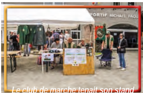
Le club de marche tenait son stand

Depuis notre Assemblée générale et le Congrès national, les activités de la Section se sont un peu calmées, à noter toutefois une participation de quelques membres de la Section et de notre Comité à la journée "famille" organisée par le Bataillon le 24 mai.