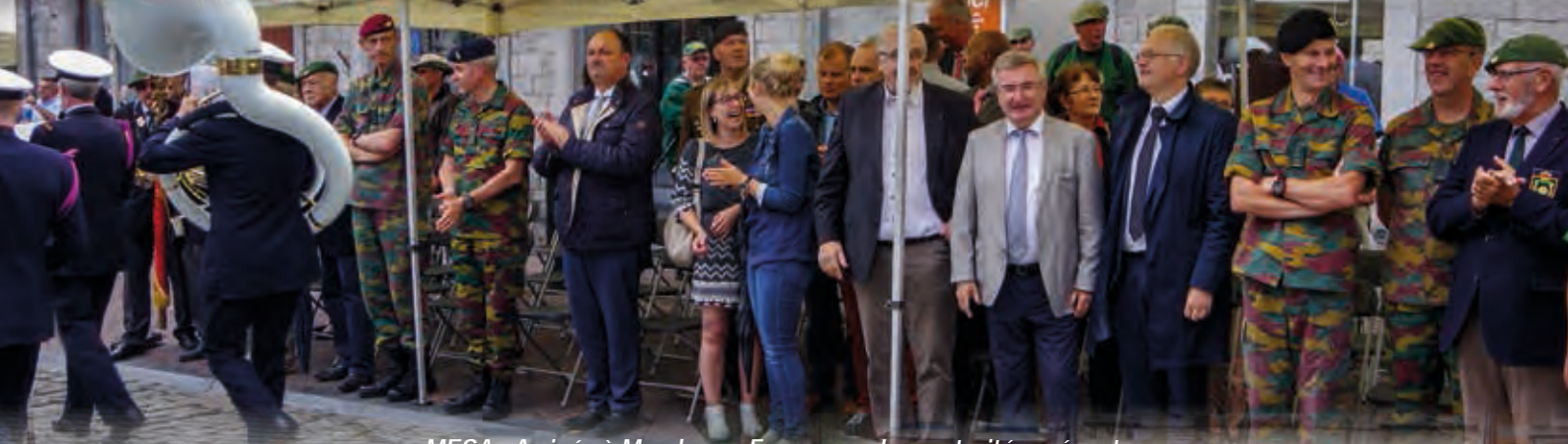
MESA - Arrivée à Marche-en-Famenne - Les autorités présentes