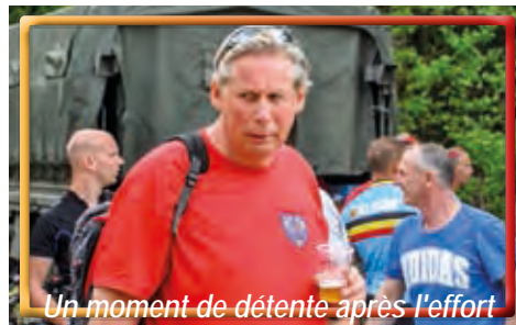
Un moment de détente après l'effort

Il s'agissait d'une après-midi détente avec quelques activités sportives plus ou moins intenses, suivant les goûts et les possibilités de chacun, allant de la marche gourmande à la randonnée vélo et divers jeux pour les enfants. Certains d'entre nous ont donné un coup de main à l'organisation tandis que d'autres ont simplement profité de l'occasion pour vivre un bon moment au cœur de nos Bérêts Verts d'aujourd'hui.